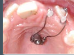
Einordnung verlagelter Zähne